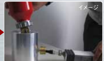
ALTESIMO (簡易リークテスター(開発中))